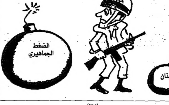
المنطقه الجاهيري الضغط لبنان (مصدر)